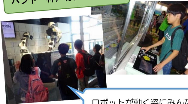
ロボットが動く姿にみんな釘付け！