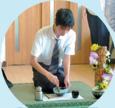
生活単元学習 「お茶でつながる国際交流」

卒業後の自立と社会参加に向けて、希望する進路を実現するとともに、地域で自分の力を発揮していくために必要な力の育成をねらいに教育活動を進めています。地域の中で多様な人たちと活動したり、作業学習で制作した製品の販売学習を設定したりしています。