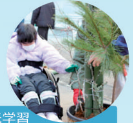
生活単元学習 「大門松づくり」