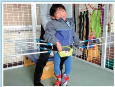
からだ学習室 - スパイダーに取り組み -