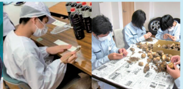
企業や福祉事業所見学・実習