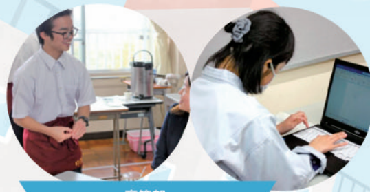
高等部 「京しごと技能検定に向けた取組」