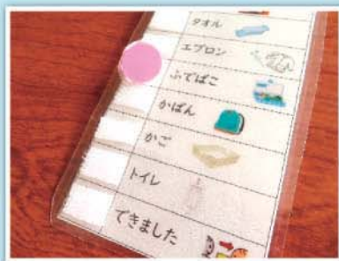
手順表 - 小学部 朝の準備 -