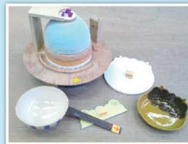
製品づくり補助具 - 高等部 作業学習(窯業) -