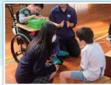
綾部高等学校生徒による 演奏教室