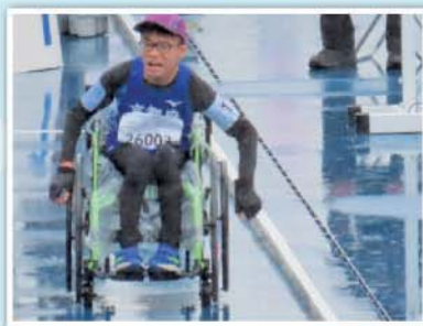
第24回全国障害者スポーツ大会 「わた SIGA 輝く障スポ」