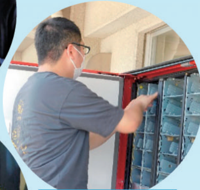
作業学習 「事務サービス」