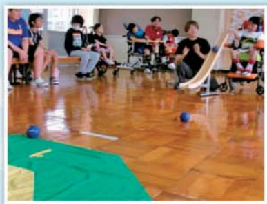
全校ボッチャ大会