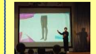
※中間発表の様子（令和元年度）