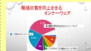
※実際に考えた提案の例