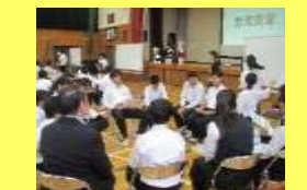
※スクールミーティングの様子（令和元年度）

※PBLとは、Project-Based-Learning（課題解決型学習）のことを指す。