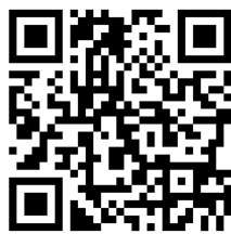
学校 HP QR コード