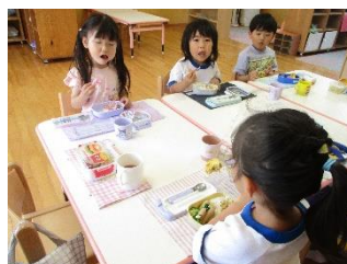
「いっただっきまーす!!」

ほし組のお友達のお弁当が始まりました。みんな食べる前からワクワクドキドキが止まりません!! 「卵焼きはいつてるねんで〜」「あ! にんじん一緒や!」とっても賑やかに初めてのお弁当の時間を過ごしました。お母さんたちがつくってくれたお弁当はとってもおいしくて、みんなぺろりと食べていました☆ 「ごちそうさまでした ☺」