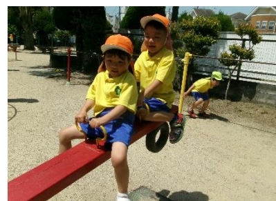
いろんな遊具で遊んだよ!!