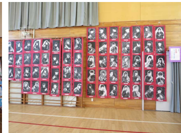
5年「リコーダーをふく自分」