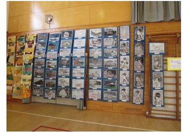
6年「古くから伝わる日本の歴史」他