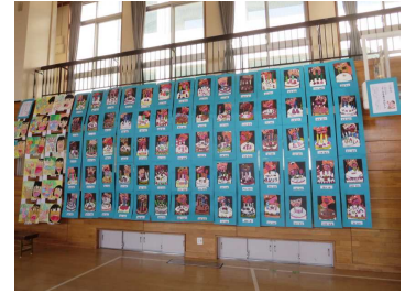
3年「ケーキを食べるわたし」他