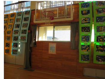
1年「うみの生きもの」

2月7日(水)の5時間目に今年度最後の参観・懇談会を行い、8日(木)との両日において体育館で「図工展」を開催しました。1年間のまとめの様子やこれまでに取り組んできた子どもたちの力作をご覧いただけたのではないかと思います。ご参観・ご鑑賞いただきました保護者の皆様、ありがとうございました。