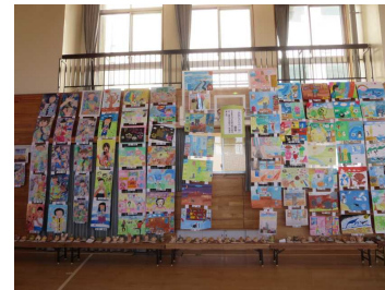
4年「お気に入りの一枚」