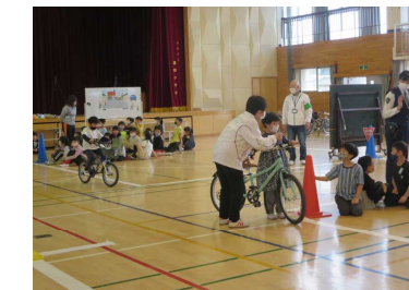
3年生 「自転車の正しい乗り方」