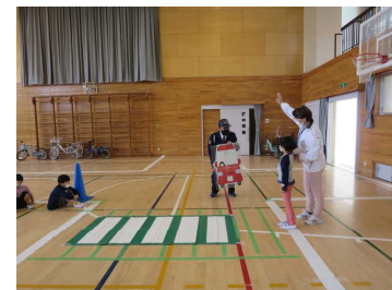
1年生 「道路での安全な歩き方」

4月21日(木)の2校時～4校時において、体育館にて1年生～3年生の交通教室を行いました。交通ルールや安全な歩行の仕方、自転車の正しい乗り方等について、城陽警察署交通課の方々と城陽地域交通安全活動推進委員の方々に教えていただきました。