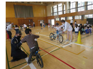
2年生 「自転車の正しい乗り方」