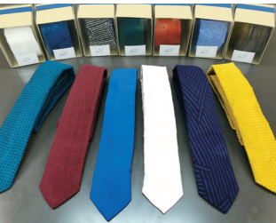
与謝の海支援学校