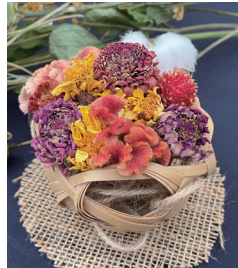
向日が丘支援学校