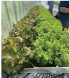
井手やまぶき支援学校