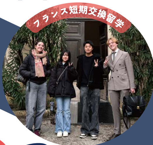
フランス短期交換留学