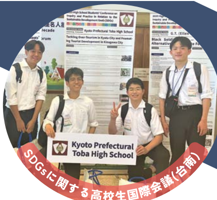
SDGsに関する高校生国際会議(台南)