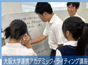
大阪大学連携アカデミック・ライティング講座