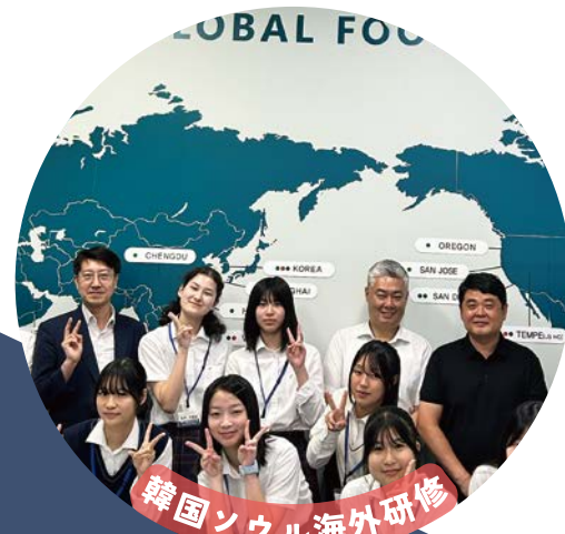
韓国ソウル海外研修