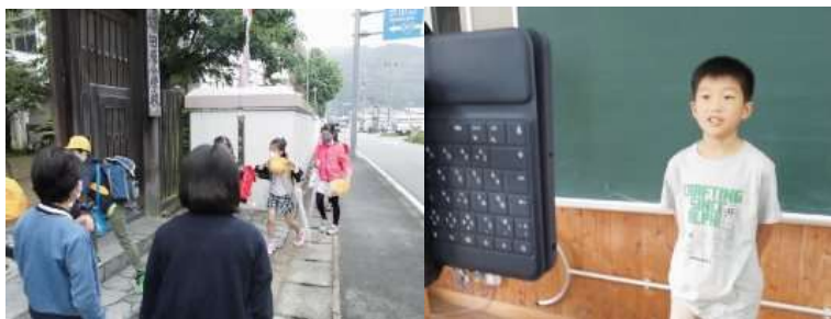
前日のすくすく広場で全校に「あいさつ運動」を伝えました。

毎朝、児童会本部役員が維孝館門前に立ち、登校してくる子どもたちに「おはようございます。」とあいさつをします。少し恥ずかしそうにする子もいますが、いつもよりしっかりとあいさつができていました。