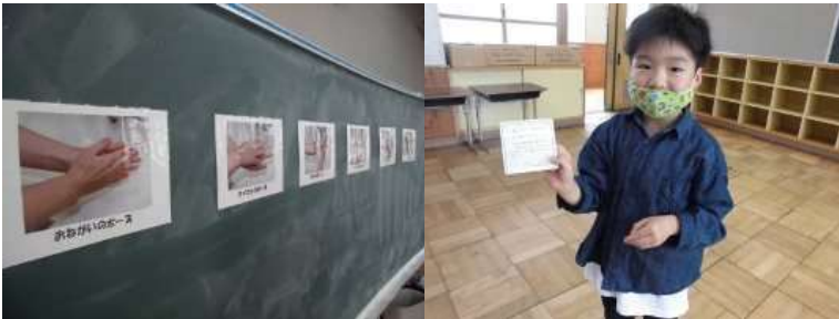
「手洗い認定証」を受け取ってにっこり