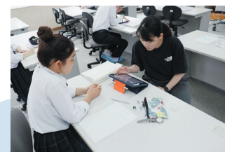
* 2年生のみらい探究の様子

私は、久美浜学舎が大好きです!もっとこの学校の魅力を知ってほしいし、もっとたくさんの人に来てほしいと思っています。そのために、学舎長にどんなことが必要かをインタビューしてみたり、動画のプロの方に相談してみたりしています。