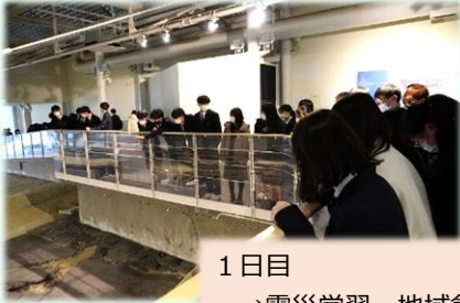
1日目 →震災学習・地域創生事業セミナー