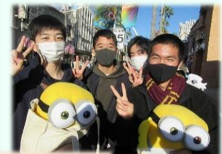
4日目 →USJ(アトラクション)