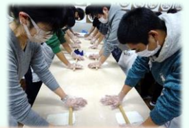
2日目 →うどん学校(体験)・金刀比羅宮観光・大塚国際美術館見学