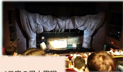
3日目 →梅田班別行動・オペラ座の怪人鑑賞