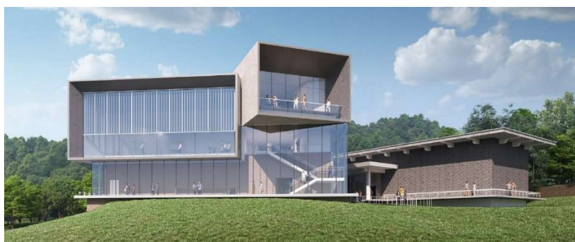
リニューアル後の外観イメージ（東南側）