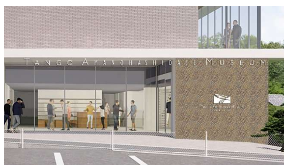
エントランスでのロゴ表示イメージ