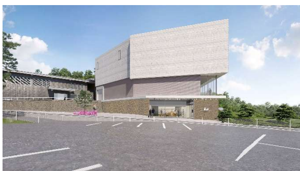
外観イメージ（西南側）