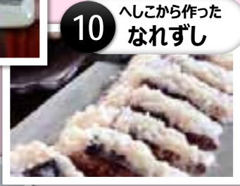
10 へしこから作ったなれずし