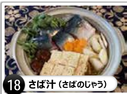
18 さば汁（さばのじょう）

▲焼きさばの頭と昆布でとった出汁に醤油、酒、みりんなどで味をつけ、切り身にしたさばと野菜で炊くもの。