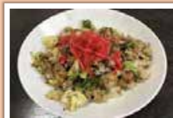
▲焼き鯖入りチャーハン

みなさんが食べたり、作ったりしている新しいさば料理がありましたら、回答欄を使ってご紹介ください。