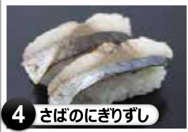
4 さばのにぎりずし