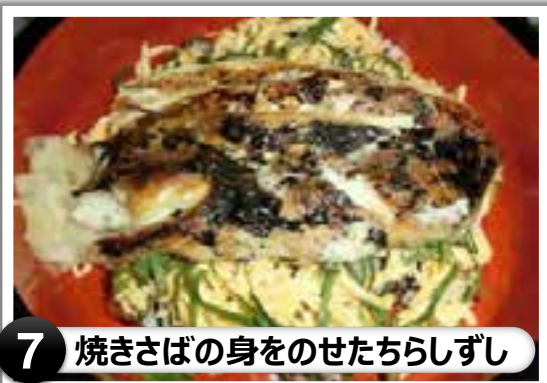
7 焼きさばの身をのせたちらしずし