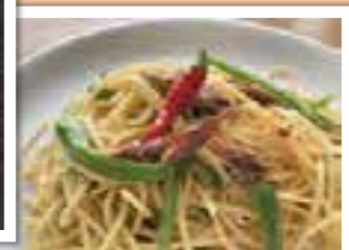
▲へしこのペペロンチーノ