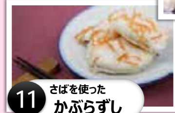
11 さばを使ったかぶらずし

◀塩漬けたかぶらにしめさばをはさみ、桶に麹とごはんを混ぜた甘酒と前述のかぶらを重ねて、2週間ほど漬けたもの。