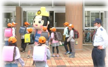
京丹後警察(駐在所)の方による登校・交通指導(4/24)