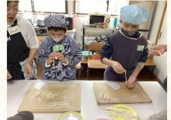
生活単元学習「うどんしょくにん」