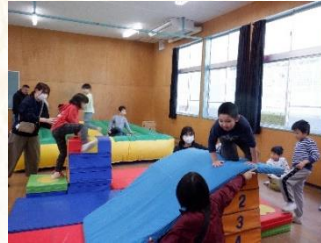
遊びの指導「ごうどうあそび」