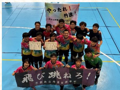
特別支援学校フットサル京都大会 準優勝 もうひとつの高校選手権大会近畿予選2年連続出場