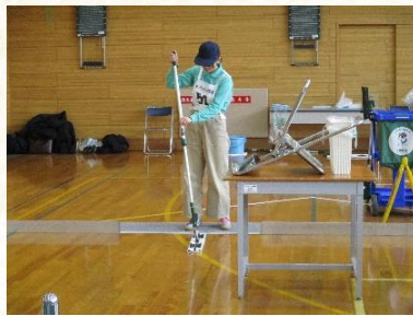
ビルクリーニング部門 金賞(最優秀賞) 令和8年度全国アビリンピック大会 出場予定