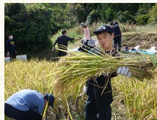
特別活動「米米くらぶ」