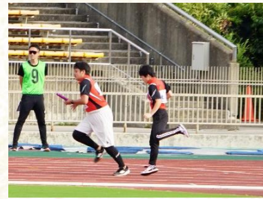
全国障害者スポーツ大会「青の煌めきあおもり障スポ」 4名出場予定(卒業生含む)