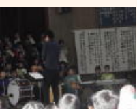
千代川小音楽発表会へ招待：参観(10/26)