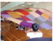
千代川小4年生との交流・共同学習(9/27・9/28・10/4・10/11)