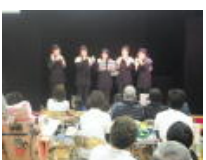
11月参観日：学校公開：芸術鑑賞会(11/25)