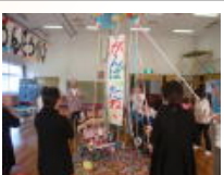
10月参観日：分校のうどんどうかい(10/21)