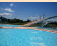
始業式(9/3)・プール学習(~9/7)