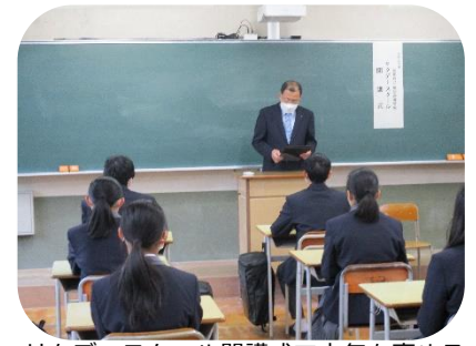
サタデースクール開講式で士気を高める