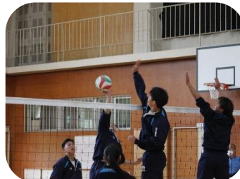
新入生歓迎球技大会