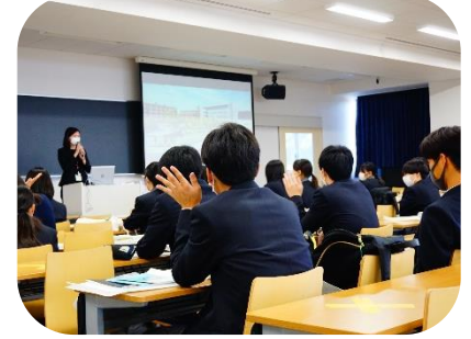
オータムセミナーで進路を明確化