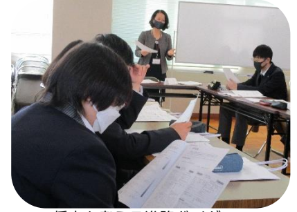
将来を考える進路ガイダンス