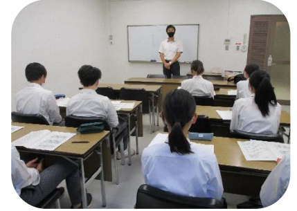
サマーセミナーで集中して学習