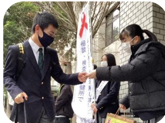
委員会の取り組み