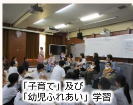
「子育て」及び「幼児ふれあい」学習