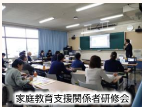
家庭教育支援関係者研修会