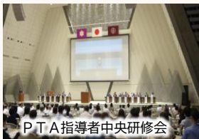
P T A 指導者中央研修会

すべての保護者が安心して子どもの教育や子育てに関わることができるよう、家庭を支える体制づくりを推進する。