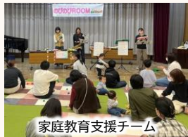
家庭教育支援チーム