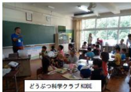
どうぶつ科学クラブ KOBE