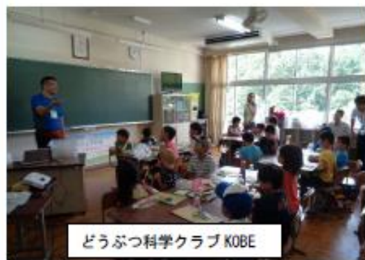
どうぶつ科学クラブ KOBE