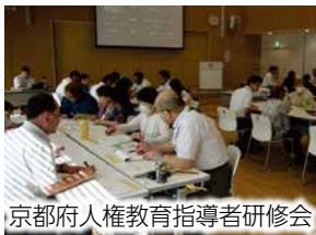
京都府人権教育指導者研修会

一人一人の尊厳を大切にするための人権意識の高揚に向けた、生涯のあらゆる機会や場を通じた人権教育を推進する。