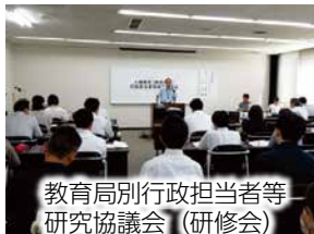
教育局別行政担当者等研究協議会（研修会）