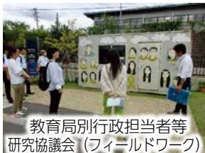
教育局別行政担当者等研究協議会（フィールドワーク）