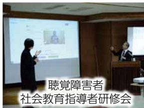
聴覚障害者社会教育指導者研修会