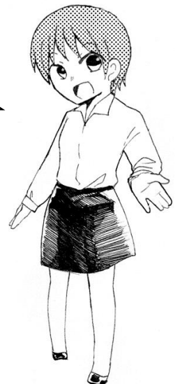
illustration by Karin Ueda (平成27年度卒業生)