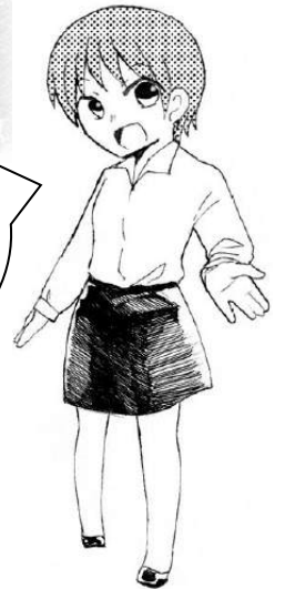
illustration by Karin Ueda (2015年度卒業生)