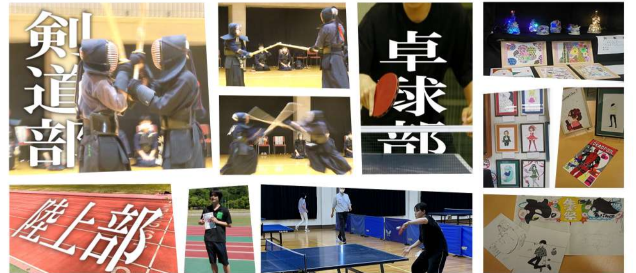
◎芸術部・漫画イラスト研究部の活動成果