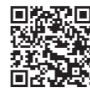
起業創造科最新情報

起業創造科は「マネジメント」と「会計」に関する分野の知識と技術を習得し、地域課題の解決を通して主体性や創造力を養います。 さらに大学や企業と連携して、ビジネスの視点から地域社会に貢献できるアントレプレナーシップ（起業家精神）を身につける、商業に関する専門学科です。2年次より学科を選択します。