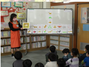
ことばの力育成支援員による読み語り

次のスタートへ向け、すべての「その二っ子」が、この時期の大切さを知り、自分自身の力を伸ばすための準備を始めることができるよう地域の皆様、保護者の皆様には引き続きお願いを申し上げます。