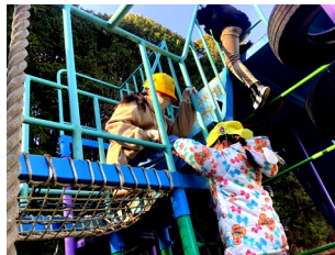
就学前の子も達との交流