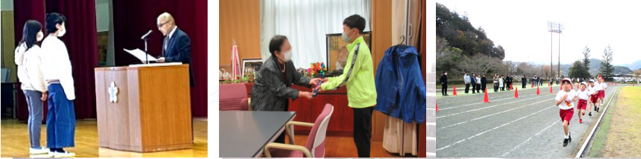
市あいさつ運動発表言語表式 園二小イチマキ 贈呈式 持久走大会(競技場)