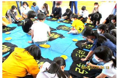
6年生「Tシャツづくり」