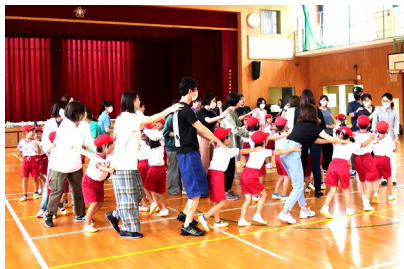
1年生「いいこといっぱい親子あそび」

各学年の学年委員様にお世話になりました。学年PTAを実施していただきました。各学年とも、工夫を凝らした活動で、当日の様子と、真剣な眼差しが見られました。計画・運営をお世話になりました。加えたいです。