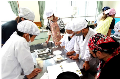
4年生「べっこうあめづくり」