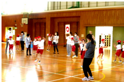
2年生「ドッチビー&OXクイズ」