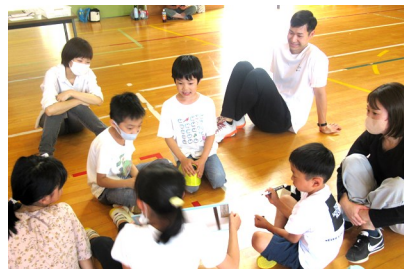
3年生「ドッチビー&学校クイズ大会」