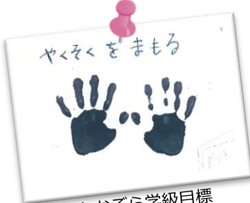
あおぞら学級目標