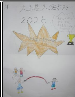
▲実行委員作成のポスター