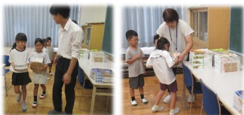
▲新しい教科書を運ぶ子ども達