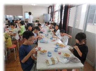
▲給食を食べる子ども達