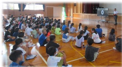
▲始業式で話を聞く子ども達

子ども達の力を更に伸ばし、安心して学校生活を送るために、ご家庭にも様々な場面でご協力をお願いすることもあります。どうかよろしく願いいたします。2学期も、各学級担任をはじめ、全ての教職員が力を合わせて、教育活動を進めていきたいと思っております。引き続きのご理解・ご支援をお願いいたします。