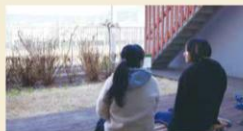
テラスでゆっくり