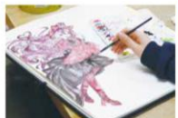
部活動をエンジョイ! 活動は 17:00 まで!