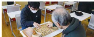
寺子屋でゲームする? 授業の課題に取り組む?