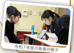
令和7年度の発表の様子

年次のみならず年度も越えて、ゼミ形式の探究活動に取り組みます!“好き”や“得意”でつながる新しい居場所を生み出しましょう!3ページも見てね♪