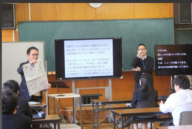
毎日200以上の記事が

3月7日（木）5・6限、京都新聞社から講師としてNIE担当の方に来ていただき、新聞を授業に活用することについてお話いただきました。「伝わる『伝え方』を考えよう」をテーマに、新聞の作り方や、ニュースを知る楽しさについて教えていただきました。ニュースとは「驚き」を伝えるもので、伝わる言葉が大切だということでした。