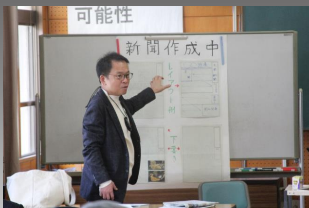
生徒の作った新聞を例に見出しの大切さを