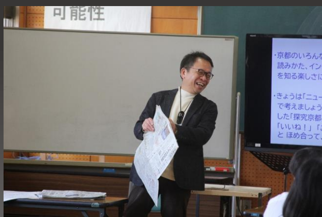
和やかな授業でした