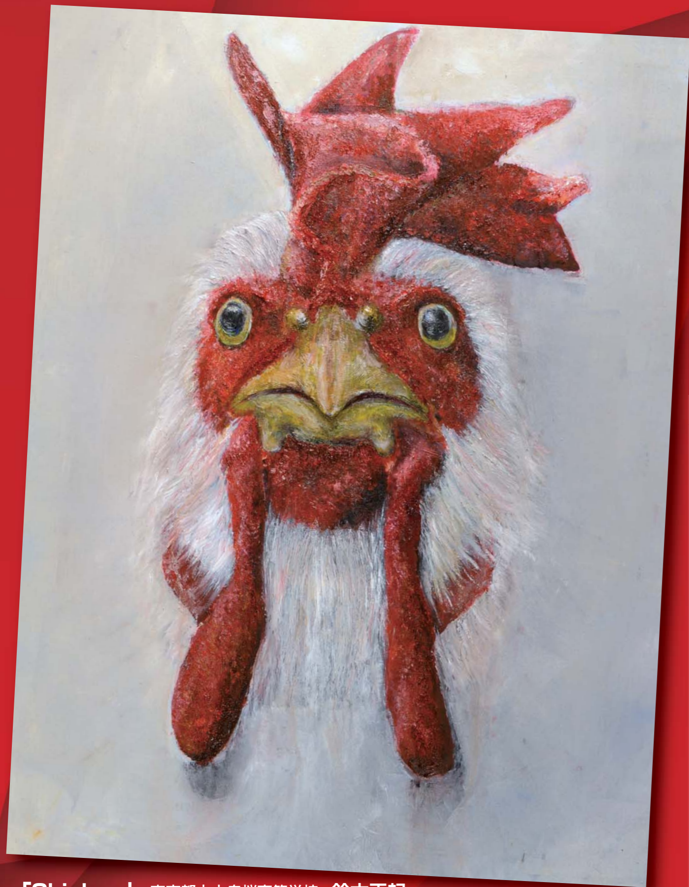
「Chicken」 東京都立大泉桜高等学校 鈴木正起