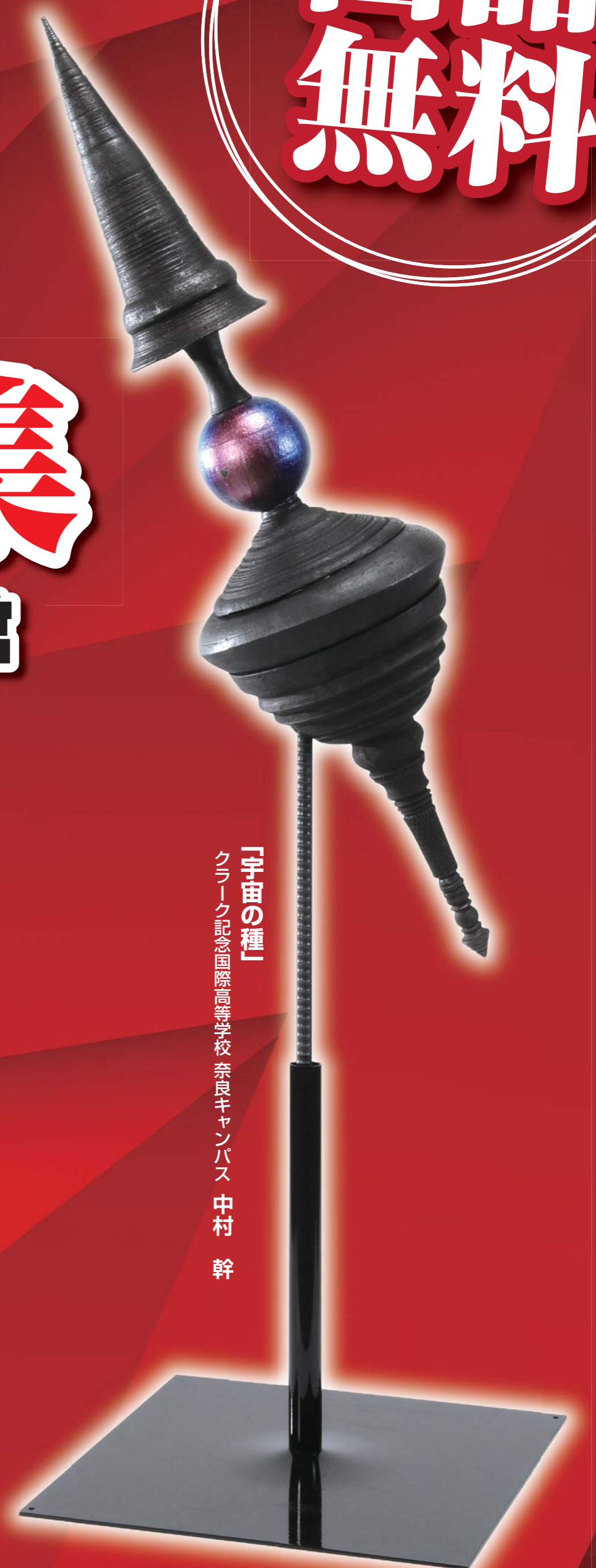
「宇宙の種」 クニキ記念国際高等学校奈良キャンパス 中村 幹