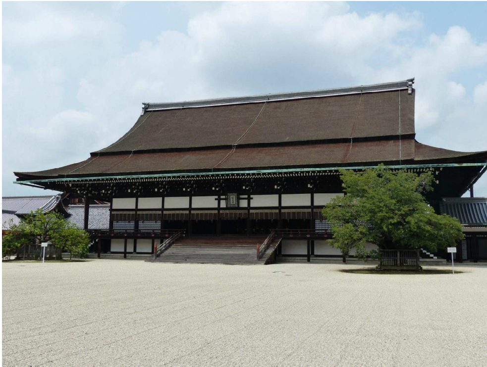
※写真は京都御所紫宸殿

後土御門の生涯は、度重なる戦乱と慢性的な皇室財政の不足によって、決して満足のいくものではなかったようです。こうした事態は、そのまま後継者である後柏原天皇へと引き継がれることになります。