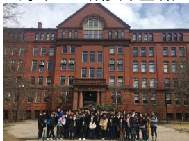
海外での研修(希望者)

本校は、豊かな自然に囲まれ、文化的な施設や大学などの知の財産も周囲にたくさんあります。この恵まれた環境を大いに生かし、上記の洛北サイエンスにかぎらず、様々な文化的体験活動を行っています。