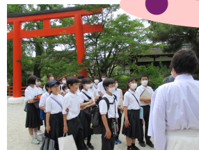
下鴨神社での校外学習