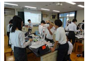
特別授業での実習

本校の中高一貫教育の基本コンセプトである「SCIENCE（サイエンス）」に沿った教育活動の1つとして、独自教科「洛北サイエンス」があります。本物との出会いをテーマに、大学や企業等から講師を招いて行う特別授業や校外学習などを行い、通常の授業では得られない学びを深める機会となっています。この経験をもとにして、充実期からはテーマに沿った研究の進め方の学習にとりかかり、発展期において個々のテーマに沿って行う課題探究につながっていきます。