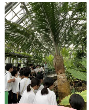
植物園での校外学習

本校は、豊かな自然に囲まれ、文化的な施設や大学などの知の財産も周囲にたくさんあります。この恵まれた環境を大いに生かし、上記の洛北サイエンスにかぎらず、様々な文化的体験活動を行っています。