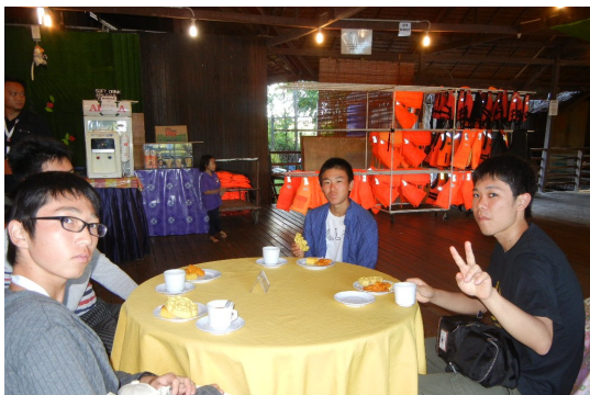
リバークルーズ乗り場で休憩

11月19日午後からクリアス川リバークルーズに行きました。カニクイザル、テングザル、ベッカムザルを観察することができました。美しい夕日やクリスマスツリーの電飾のようなホタルも見ることができ、みんな感動しました。