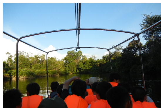
クルーズ船でサルを探す