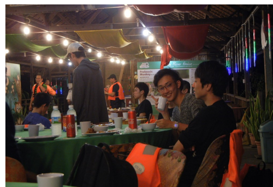
マレー料理の夕食