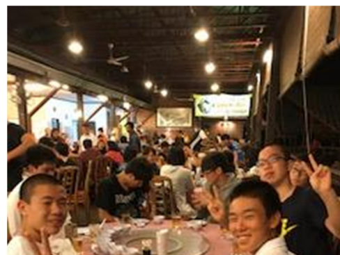
コタキナバルで海鮮中華の夕食 この後民族舞踊ショーで盛り上がる