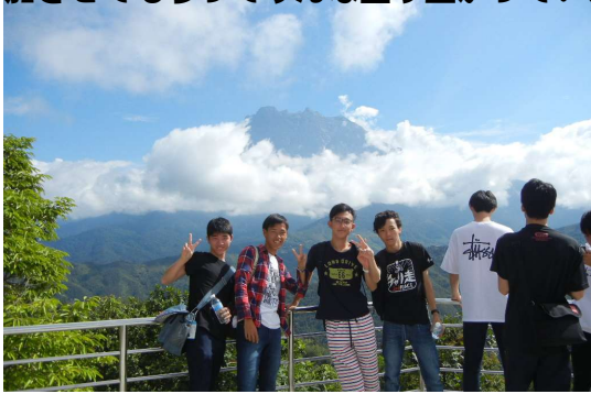
今日はキナバル山の山頂を見ることができました

11月20日、今日はキナバル自然公園とポーリン温泉へ行きました。自然公園は標高1500m、ミニトレッキングをしながらランの花やウツボカズラを観察しました。ポーリン温泉は標高500m、ウバメガシの巨木の森を歩き、キャノピーウォークで林冠の様子を観察、温泉では足湯につかりました。夜は夕食後計画にはなかった民族舞踊ショーを見学、一緒に参加させてもらってみんな盛り上がっていました。