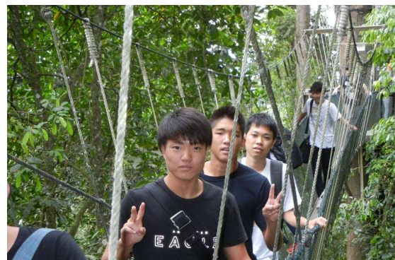
ポーリン温泉でキャノピーウォーク