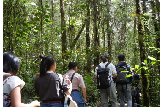
キナバル自然公園をミニトレッキング