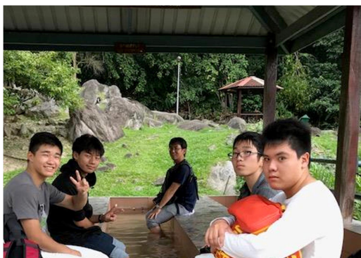
ポーリン温泉で足湯につかる