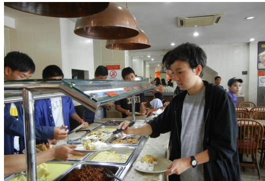
クチンでチキンバイキングの昼食