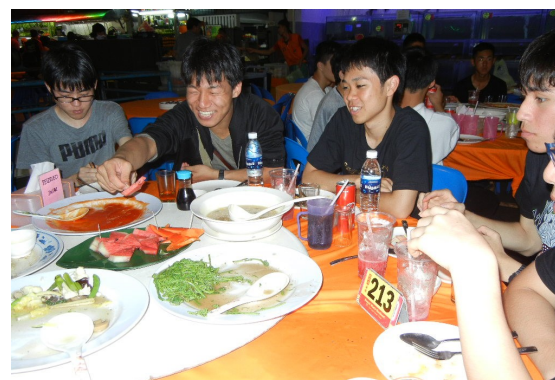
海鮮中華の夕食、お腹いっぱいになりました