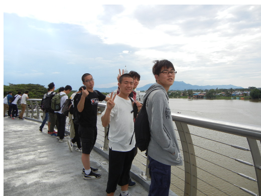
クチンのウォーターフロントにて