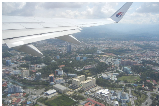
3日過ごしたコタキナバルを離れる

11月21日 今日コタキナバルを離れ、空路サラワク州の州都クチンへ。昼食ののち、セメンゴワイルドリハビリテーションセンターへ。運よく多くのオランウータンが出てきてくれ、身近に見ることができました。保護されている大きなワニも見られました。