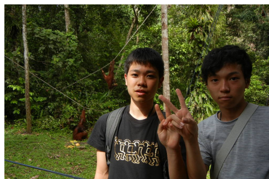
オランウータンをバックに