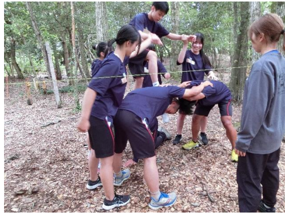
【エレクトリックフェンス】

全員が手をつないだままで、地面に落ちないように渡ります。 お互いに声掛けをしながらでなければ渡り切れない 絶妙な間隔です。