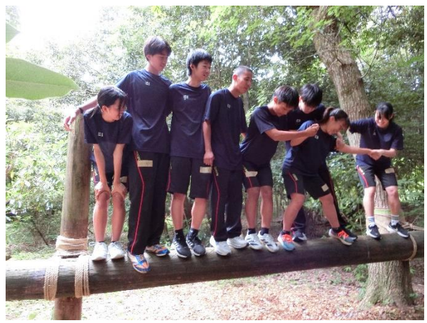
【ラインナップ】丸太の上で誕生日順番に並び替え！ 落ちたらやり直し！