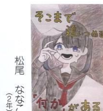
松尾 ななこ (2年)