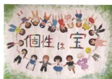
崎山 真菜 (2年)