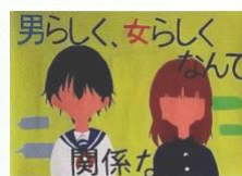
佐々木 陽菜 (2年)