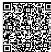
欠席連絡フォーム

お忙しい時間帯かとは思いますが、登校途中の安全安否確認のためにもよろしくお願ひします。