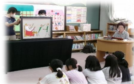
サマーライブラリーのーコマ

夏の照りつける暑さで、連日熱中症への警戒情報が出ています。本当に厳しい暑さが続いています。そのような中、保護者の皆様には、お子様が元気で過ごせるように健康や生活習慣に気を付けていただき、感謝申し上げます。