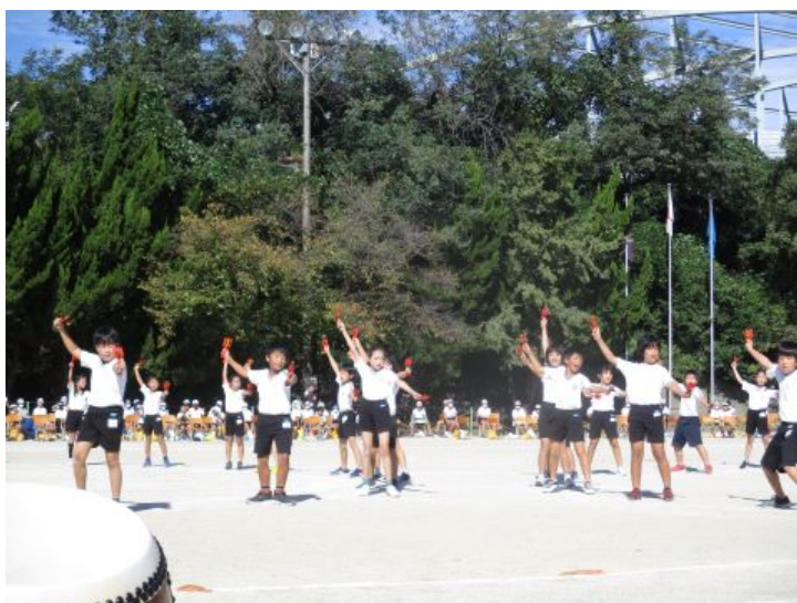
5年生 「ロックソーラン～荒波をこえていけ～」