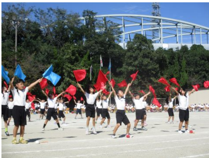
3年生 花笠音頭～咲かせよう！100人の花！～