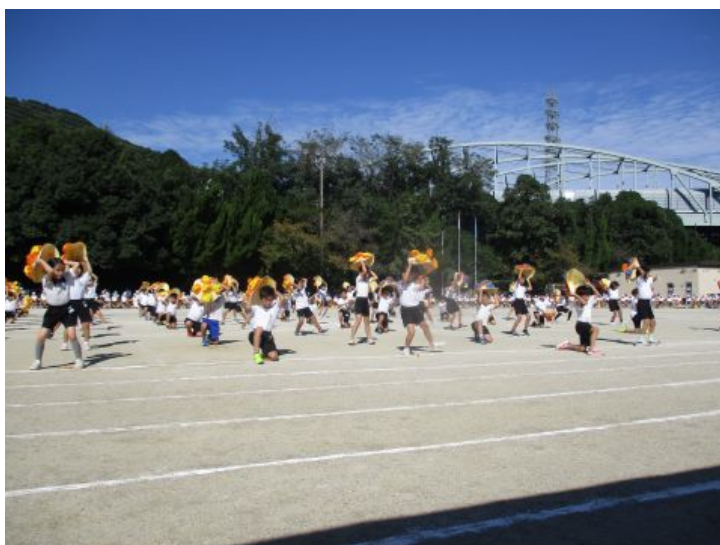
4年生 「よっちょれ～疾風迅雷～」