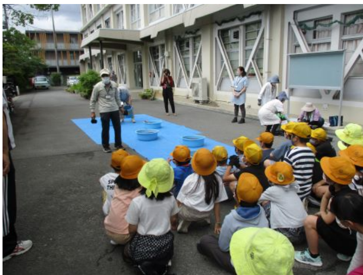
お水をあげて～「早く芽がでますように～」