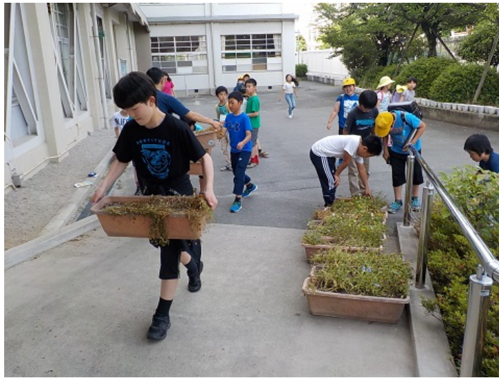
美化・園芸委員会