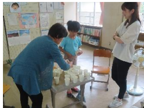
すぎの子2組生活単元:気持ちを表す言葉