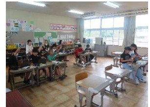
6年生国語:たのしみは～表現を工夫して短歌をつくらう～