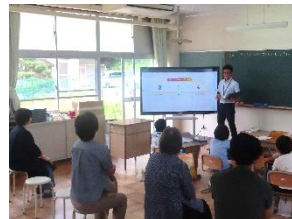
1年生算数:たしざん