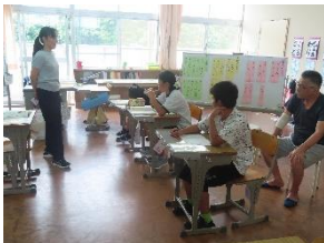
すぎの子1組国語:たのしみは～おじいちゃんおばあちゃんと短歌を作ろう～

今後も子ども達の様子を参観していただく機会を工夫していきたいと考えていますので、教育活動へのご理解・ご協力をどうぞよろしくお願いいたします。