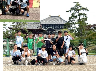
令和8年度 7月 大宮南小学校バス運行予定表