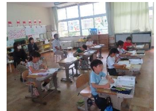
2年生算数:見方・考え方をふかめよう