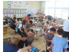
5年生家庭科:ソーイング