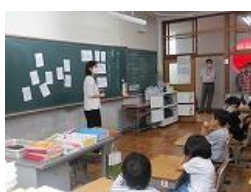
2年生 国語「同じ部分をもつ漢字」