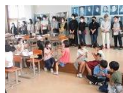
3年生 音楽「こころの歌」