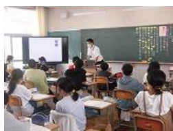
6年生 国語「たのしみは」