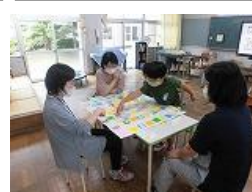
ひまわり2 生活単元「すくろくをしよう」