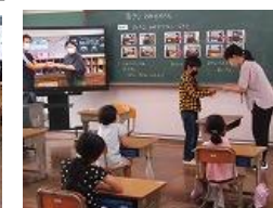
ひまわり3 生活単元「すてきなお店さん」