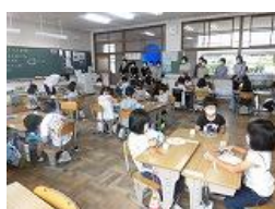
1年生 図工「つくってあそぼう」