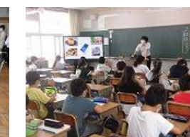
5年生 国語「和語・漢語・外来語」