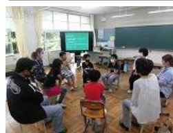
ひまわり1 国語「スピーチ大会」