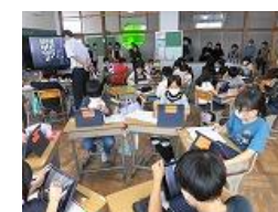
4年生 国語「つぎ言葉のはたらきを知ろう」