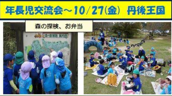
年長児交流会～10/27(金) 丹後王国