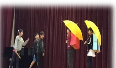
4年：私たちと世界の子どもたち