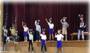
1年：おむすびころりん