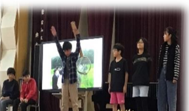
5年：秋だ！虫だ！お米だ！～お米作りから学んだこと～