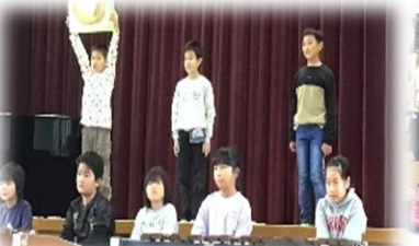
3年：大へんだけどがんばるべん強