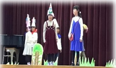
2年：ミリーのすてきなぼうし