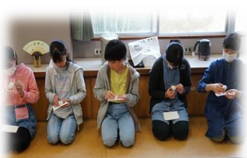
上用饅頭をいただく

10月16日（月）、大宮南小の6年生児童が地域の「茶事・茶道教室（大同宗裕社中）」の皆様にお世話になり、「茶道」を体験しました。小学校の和室もこの体験中は異空間。児童たちは茶道の先生から様々な所作を教えてもらいながら、茶の湯に向き合っていました。