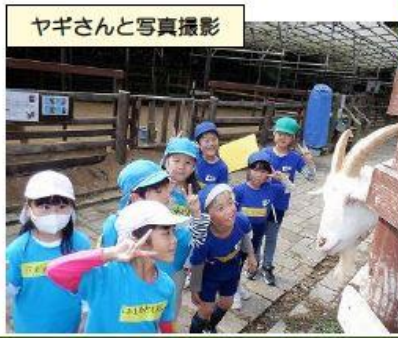
ヤギさんと写真撮影