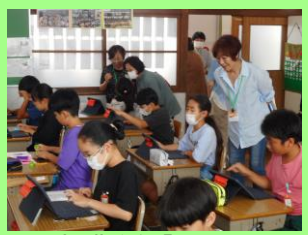
【民生児童委員による授業参観】